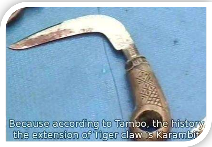
Because according to Tambo, the history the extension of Tiger claw is Karambit